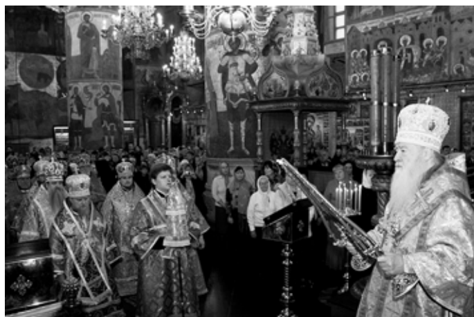
Богослужение возглавил Митрополит Крутицкий и Коломенский Ювеналий

Святейший Патриарх сегодня совершает великое освящение в новопостроенной церкви в честь Введения во храм Пресвятой Богородицы в г. Москве, и поэтому благословил нам совершить сегодня праздничное богослужение в этом святом соборе. Я очень рад приветствовать сегодня собратьев архиереев, священнослужителей, которые сослужили Божественную литургию, и всех вас, кто любит богослужения и с ревностью их посещает. Сегодня в нашем храме также молились учащие и учащиеся Военной академии Российских войск стратегического назначения им. Петра Великого. Я хотел бы от души сердечно поздравить сегодня военачальников и воинов ракетной академии с наступающим днем основания Академии и 50-летним юбилеем Ракетных войск стратегического назначения. Мы радуемся, возлюбленные братья и сестры, что пали те идеологические барьеры, которые в прошлом веке нас разделяли. Сейчас мы — единый народ, который вместе созидает великую нашу державу — Россию.