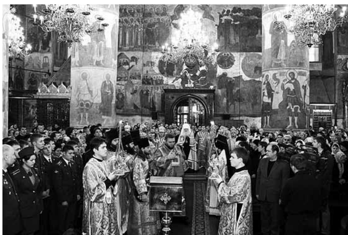
На Литургии сослужили клирики г.Москвы и Московской епархии

за Божественной литургией молились о блаженнопочившем Святейшем Патриархе.